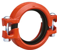
2 – 12"/DN50 – DN300