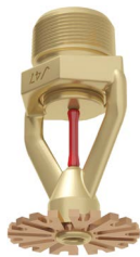
Sprinkler cu capul în jos V4702